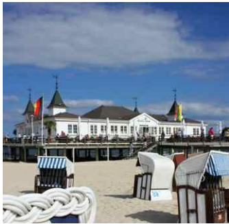
Historische Seebrücke in Ahlbeck auf Usedom, Foto: Sucher/Wurlitzer

B. W.: Zunächst werden die Notizen entziffert und geordnet. Dann beginnt die Diskussion, was wir von unseren Entdeckungen in die nächste Auflage aufnehmen werden. Wollen wir beispielsweise ein neues Restaurant empfehlen, das uns mit seinem Ambiente und/oder seiner Küche beeindruckt hat, dann heißt das, aus Platzgründen muss etwas anderes gestrichen werden. Aber was? Darüber diskutieren wir manchmal eine Ewigkeit. Und dann geht es los mit dem Schreiben.