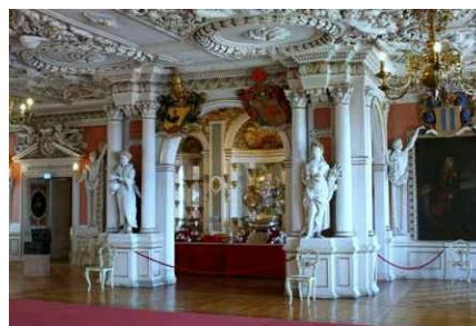
Festsaal Schloss Friedenstein in Gotha