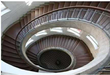
Weimar, Treppenhaus Bauhaus Universität, Foto: Wurlitzer